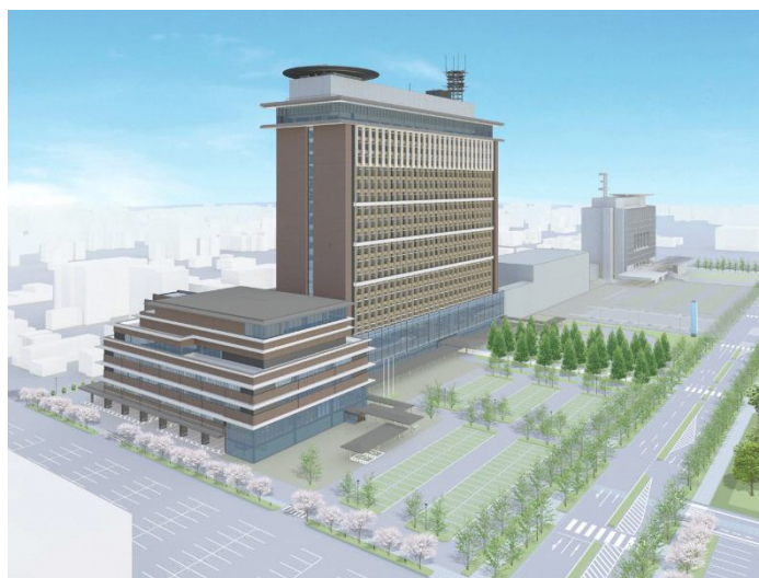
Ilustração externa do novo prédio

[Locais para acesso ao manual do projeto executivo]