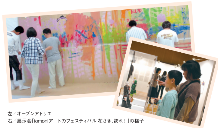
左/オープンアトリエ 右/展示会「tomoniアートのフェスティバル 花さき、誇れ!」の様子

TASCぎふでは、障がいのある方もない方もともに自由に創作活動を行える「オープンアトリエ」を定期的に開催しています。ほかにも、ワークショップや展示会の開催などさまざまな取り組みを通して、障がい者の文化芸術活動を多面的に支援しています。