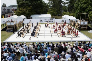
争夺天下之地关原“东西人间象棋”

以关原之战和东西对决为焦点的活动即将举行。将举行争夺天下之地关原的“东西人间象棋”、与棋手们巡游古战场、重现关原之战情景的短剧和由东西日本的著名拉面店、肉店举行的“东西美食家对决”等一系列活动。