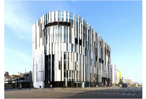
富山市玻璃美术馆外观

为庆祝7月5日“富山・岐阜交流日”，特举办可感受富山县魅力的大巴一日游。将访问富山市玻璃美术馆。