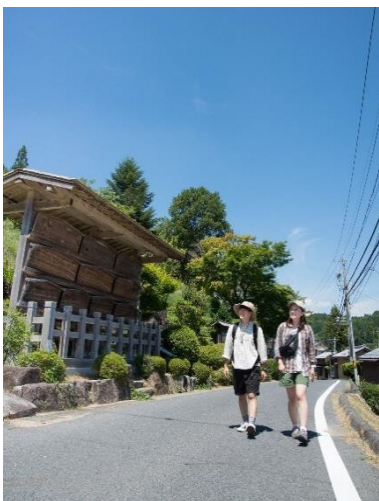
Caminhada pelas cidades estações

É um programa "Caminhar se divertindo em um passeio por Gifu" realizado nos 126,5km da rota Nakasendo que passa pela província e nas 17 cidades estações. Os participantes poderão experimentar algumas atividades exclusivas da época do verão em Nakasendo, como a caminhada pelas cidades estações, etc.