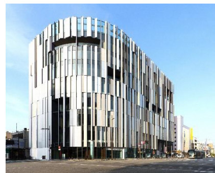
Fachada do Museu de Artes em Vidro de Toyama-shi

Em comemoração ao dia 5 de julho, "Dia do intercâmbio Toyama-Gifu", será realizado um passeio de ônibus de 1 dia para apreciar os atrativos da província de