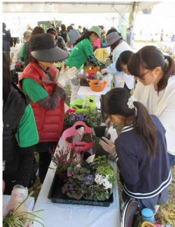
插花体验教室的情景

举行任何人都可以参加的插花体验教室，届时将展示色彩鲜艳的插花作品并进行县内花卉品评会。还将在当日的鲜花节中举行秋季“万圣花园”活动。一起度过被五颜六色花朵环绕的一天吧。