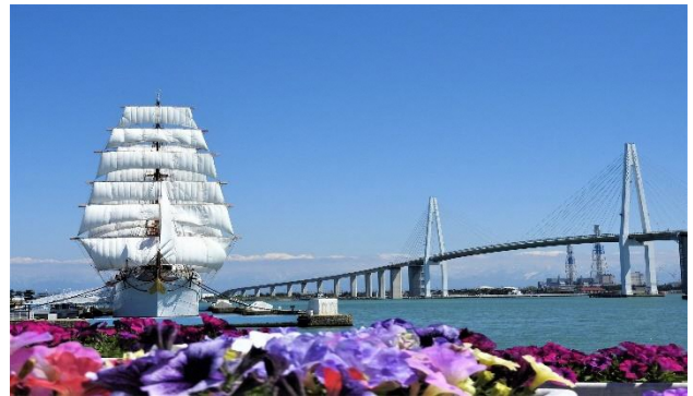
富山湾和新湊大桥(海王丸公园)

富山县与岐阜县将联手互相展示县内魅力。使用两县企划的高速公路折扣券，可以在周游区域内按固定价格无限量驾驶，一起到充满魅力的富山自驾游吧!