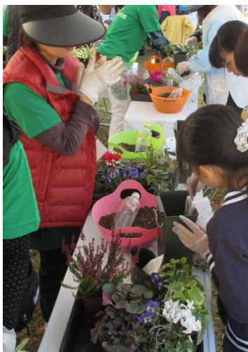
Imagem do workshop de yoseue

Neste evento haverá exposição de arranjos florais coloridos, exibição e avaliação das flores cultivadas nesta província e workshop de yoseue na qual qualquer pessoa pode participar. Além disso, no mesmo dia também será realizado o Autumn Garden Show "Halloween Garden".