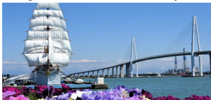
Baía de Toyama e a Ponte Shinminato (Kaiyomau Park)

As províncias de Toyama e Gifu promovem os seus atrativos de forma mútua através de uma parceria. As duas províncias elaboraram em conjunto um desconto no pedágio que permite utilizar um trecho da rodovia expressa ( kōsoku dōro ) ilimitadamente por um valor fixo. Que tal aproveitar esse desconto e fazer um passeio de carro para conhecer os atrativos da província de Toyama?