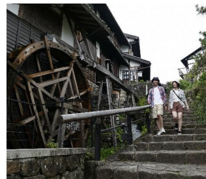
Nakasendo – Magomejuku

É o evento mais simbólico de Nakasendo que tem como palco o caminho Nakasendo que passa pela província e as 17 estações. Aproveite os passeios atraentes