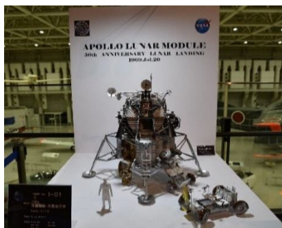
Módulo Lunar Apollo (maquete escala 1/15) (Obra vencedora do Concurso Nacional de Maquete de Satélite Artificial e Robô Lunar)

50 anos da chegada do homem à Lua. Esta exposição apresenta os atuais programas espaciais, tais como o “Gateway” previsto para ser desenvolvido como uma estação espacial em órbita lunar, o robô lunar tripulado, os programas espaciais de empresas privadas, entre outros.