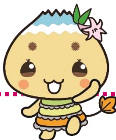
恵那市公式キャラクター エーナ

糖尿病で血糖コントロール不良の方が新型コロナウイルスに罹った場合、重症化する方が多いことが分かっていますので、定期的な受診に十分留意してください。