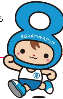
中津川市健康づくり推進キャラクター けんぱちくん

治療の中断は、高血糖の状態を引き起こし、その状態が続くことで様々な合併症を発症させたり、合併症・併存症を重症化させ、最も予後を悪化させると言われています。