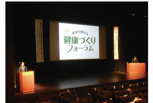
昨年度の健康づくりフォーラムの様子

また、会場では、健康測定機器を使って血管年齢や脳年齢などを測ることができる健康チェックコーナーのほか、優れた健康経営の取り組みを行っている「健康経営優良企業」を紹介します。この機会に、健康づくりについて考えてみませんか。