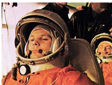
Yuri Gagarin

Será realizado um evento em comemoração aos 2 anos de inauguração do Museu Sorahaku. O evento conta com a exposição de painel