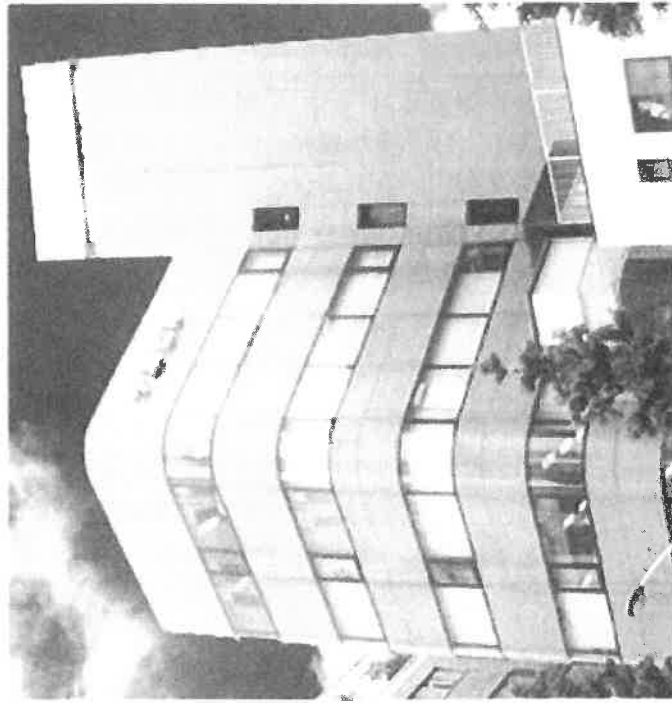
株式会社 LJM ジャパン

【東会場 (東京)】 LJM 東京研修センター (文京区本郷 1-11-14 小倉ビル)