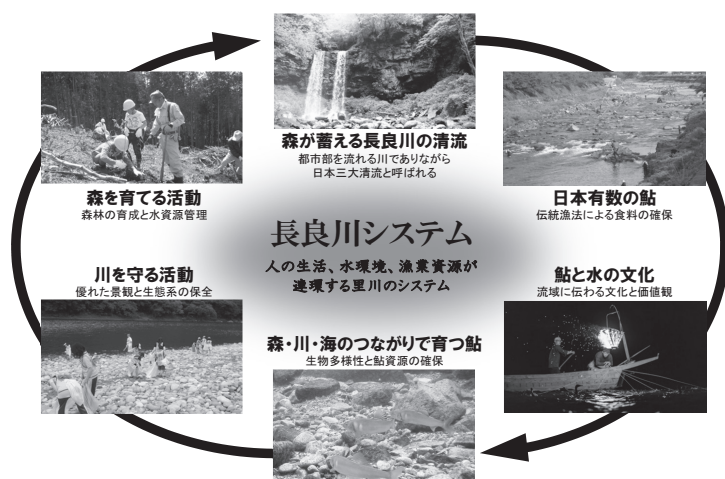
図2-4-3 長良川システム

今後、「清流長良川の鮎」を進化させながら、将来にわたり守り伝えるため、世界農業遺産「清流長良川の鮎」アクションプランに基づく取組みを着実に進める。