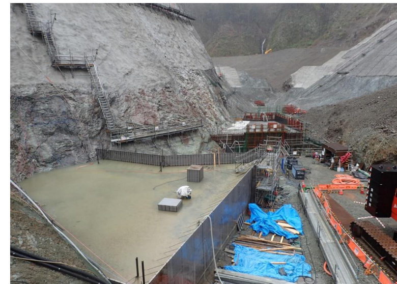
⑥ コンクリート打設進捗状況(R2.4末時点)