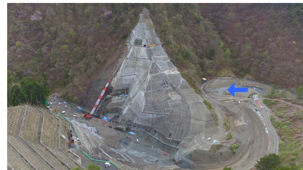
④ ダムサイト右岸状況(左岸上空より望む)