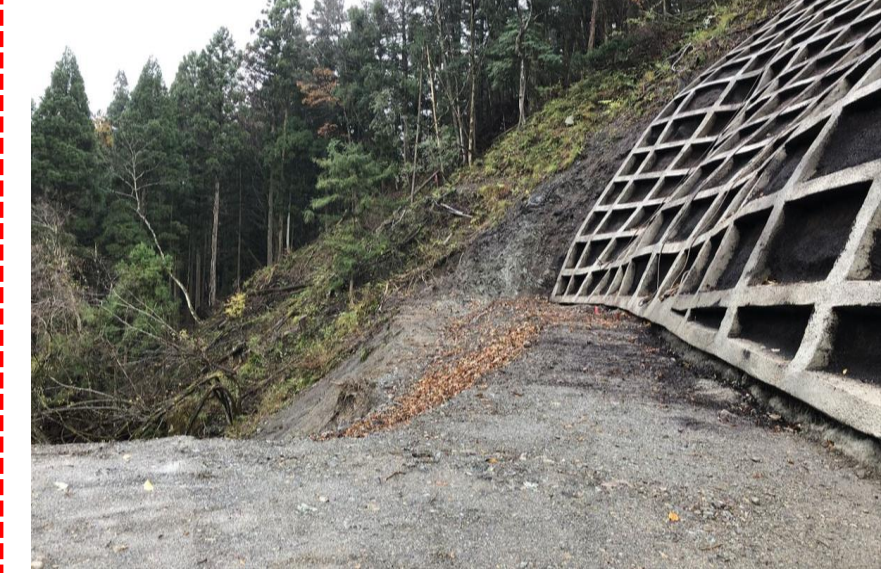
⑤ 下流工事用道路状況