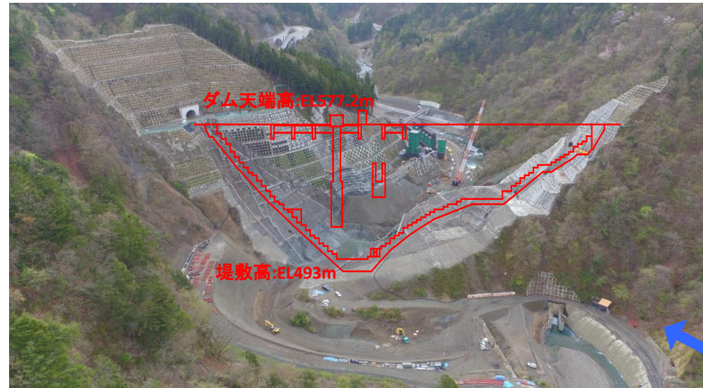
① ダムサイト状況(上流上空より望む)