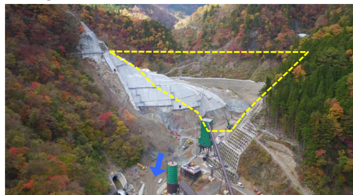
① ダムサイト状況(遠景:下流上空より望む)