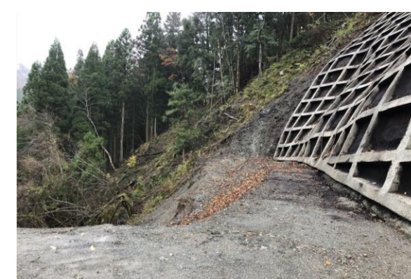
⑤ 下流工事用道路状況