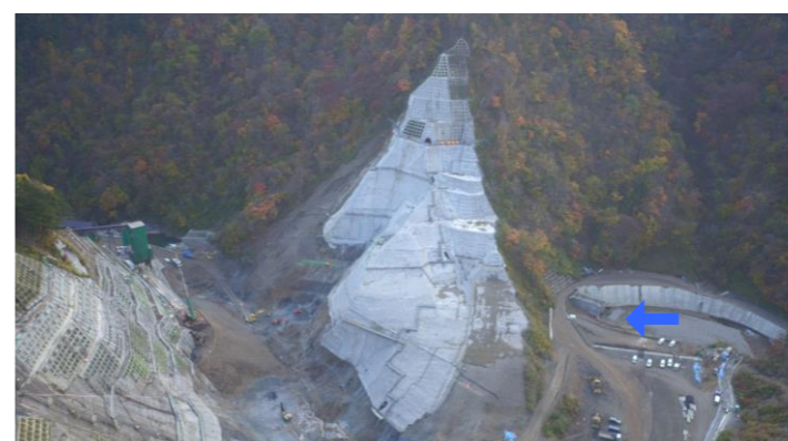
④ ダムサイト右岸状況(左岸上空より望む)