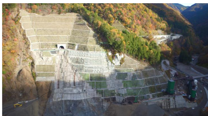
③ ダムサイト左岸状況(右岸上空より望む)