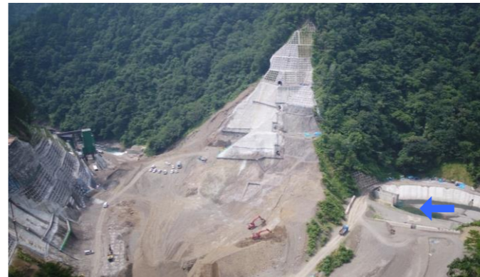
④ ダムサイト右岸状況(左岸上空より望む)