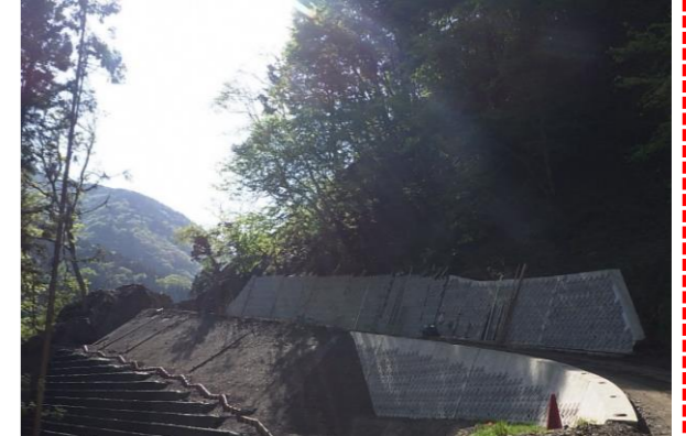
⑤ 下流工事用道路状況