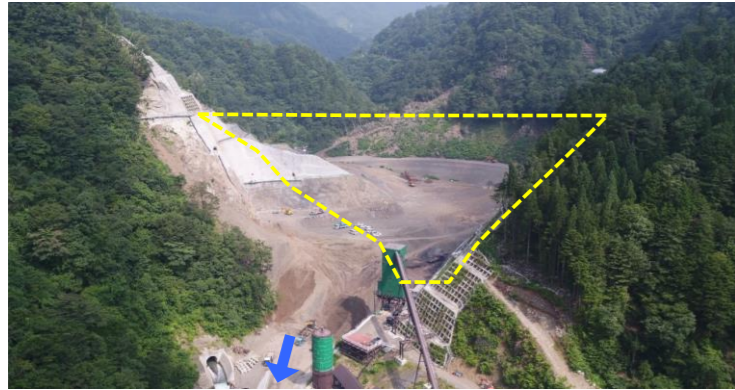
① ダムサイト状況(遠景:下流上空より望む)