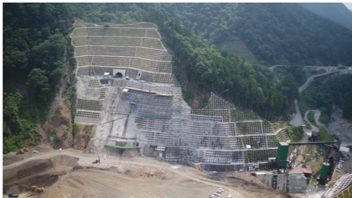
③ ダムサイト左岸状況(右岸上空より望む)