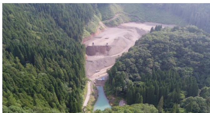
⑥ 土捨場状況(上空より望む)