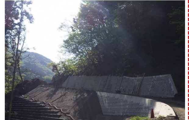
⑤ 下流工事用道路状況