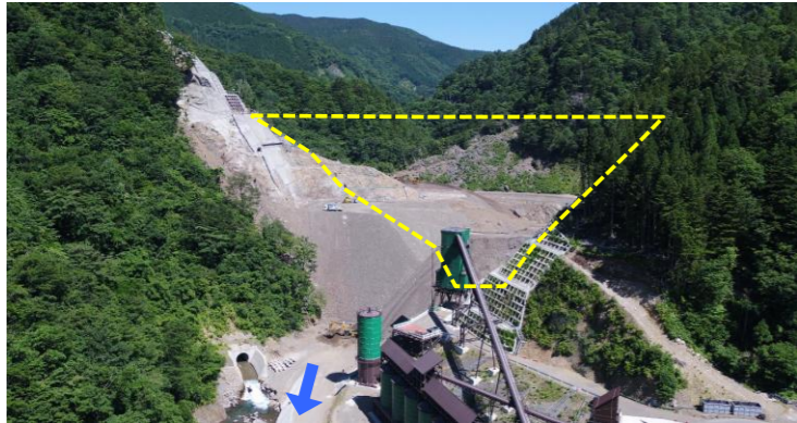
① ダムサイト状況(遠景:下流上空より望む)