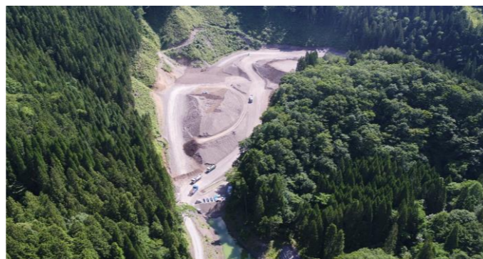
⑥ 土捨場状況(上空より望む)