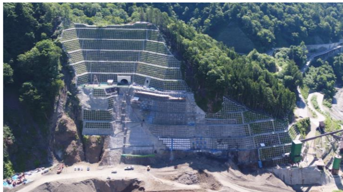
③ ダムサイト左岸状況(右岸上空より望む)