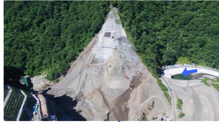
④ ダムサイト右岸状況(左岸上空より望む)