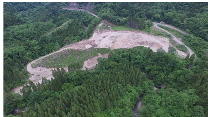
⑦ 原石山状況(上空より望む)