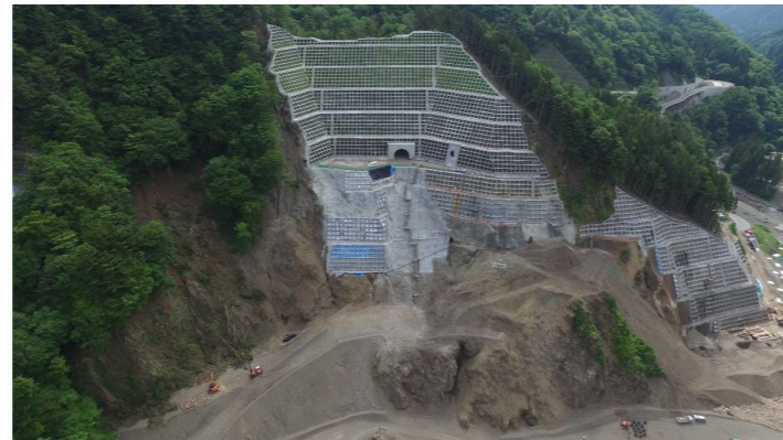
③ ダムサイト状況(右岸上空より望む)