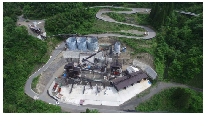
⑥ 骨材プラント状況(上空より望む)