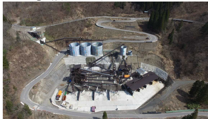
⑥ 骨材プラント状況(上空より望む)