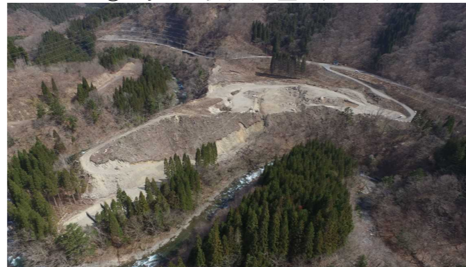
⑦ 原石山状況(上空より望む)