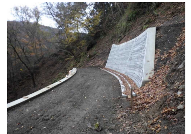
⑤ 下流工事用道路状況