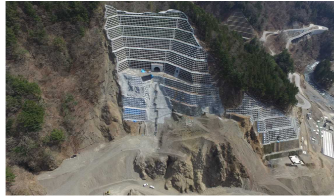
③ ダムサイト状況(右岸上空より望む)