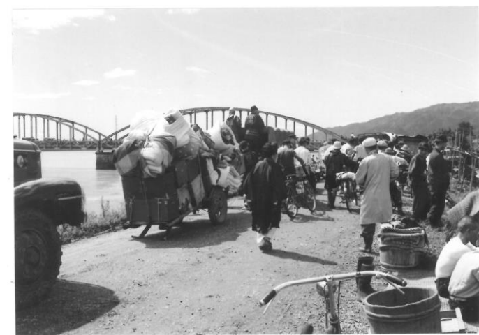
被災地から避難する人たちで混雑する 今尾大橋付近の様子