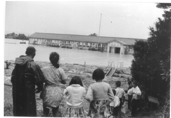
6 8月の集中豪雨と伊勢湾台風で2度の 浸水被害を受けた池辺小学校 (養老町内)