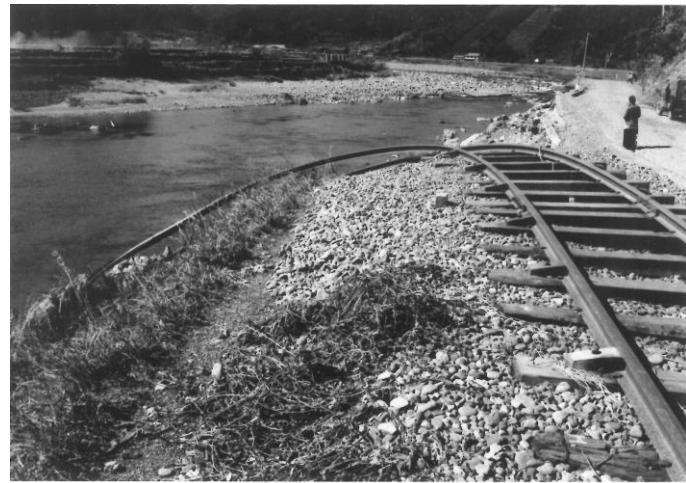
5 落橋した国鉄越美南線の線路 (郡上市内)