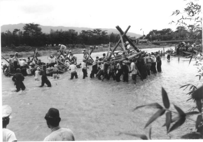
3 決壊口の仮締切の作業をする自衛隊員 ら (大垣市内相川)