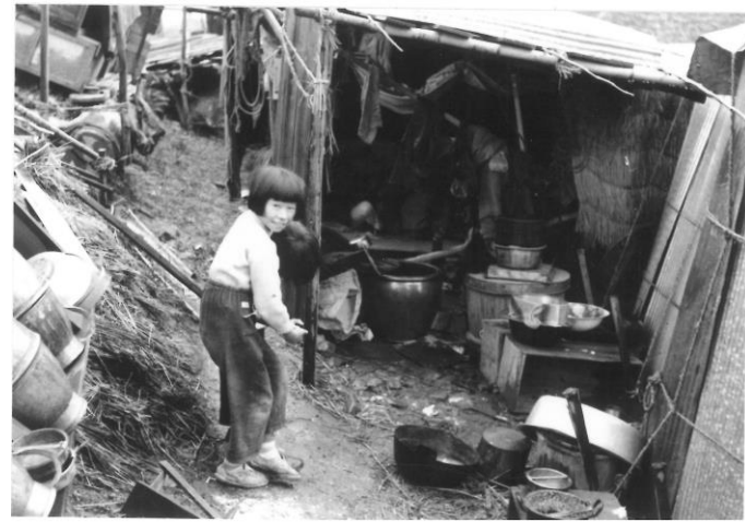
不自由な仮小屋生活の様子 (養老町内)