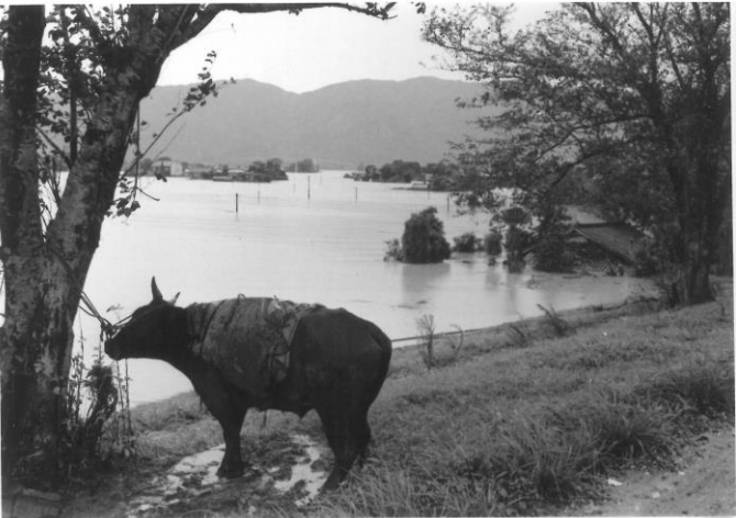
4 堤防の木に繋がれた牛。当時は農作業の ため各農家に牛が飼育されていた。 (養老町内)