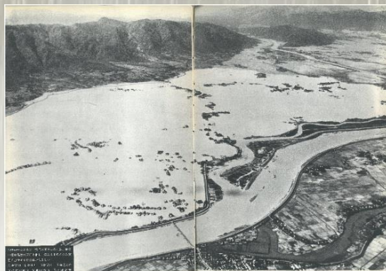
空から見た養老町の一帯 (伊勢湾台風通過後)