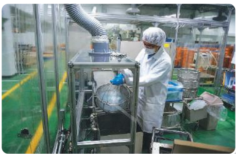
医療器具の洗浄作業の様子