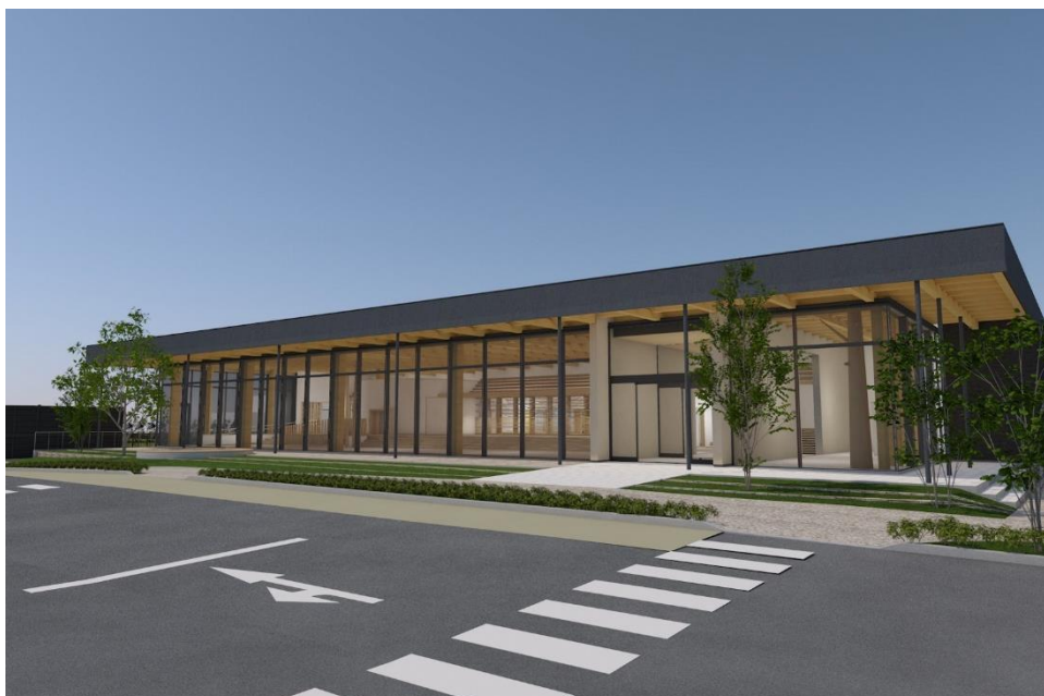
【木のふれあい館（仮称）イメージ図】