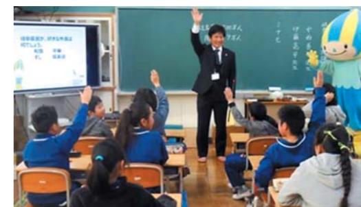
平成29年1月 関市立南ヶ丘小学校4・5年生のみなさんと