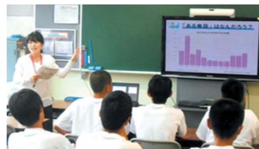
平成29年6月 岐阜市立陽南中学校のみなさんと