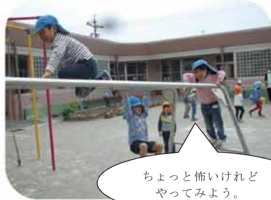
ちょっと怖いけれどやってみよう。