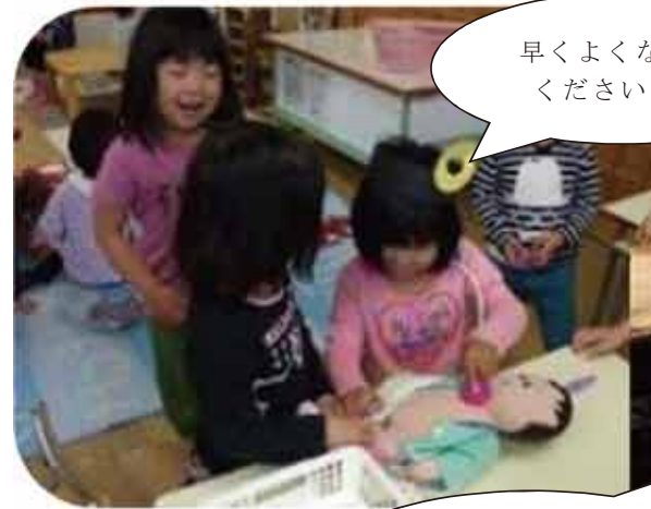
早くよくなってくださいね。