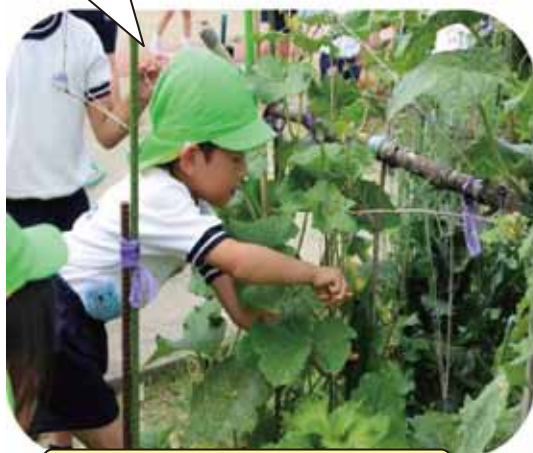
栽培活動（きゅうりの収穫）