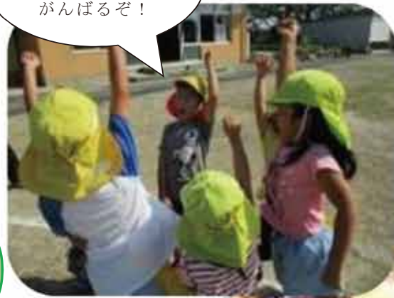
みんなで力を合わせてがんばるぞ！