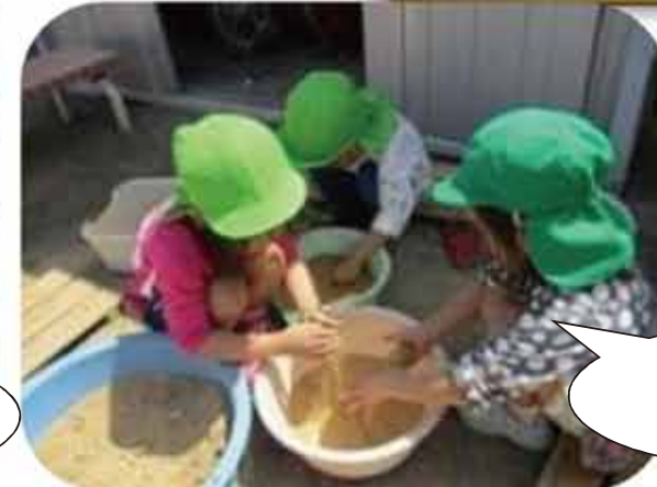
この粉はさらさらだね。