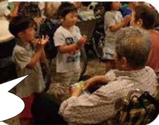
♪花が咲いたら、じゃんけんぽん♪