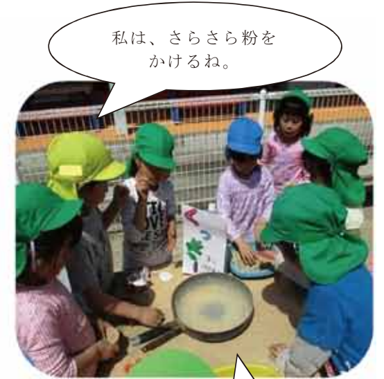
私は、さらさら粉をかけるね。