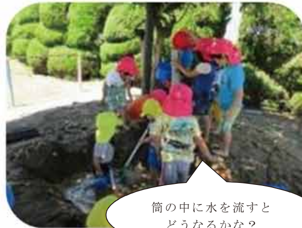
筒の中に水を流すとどうなるかな？