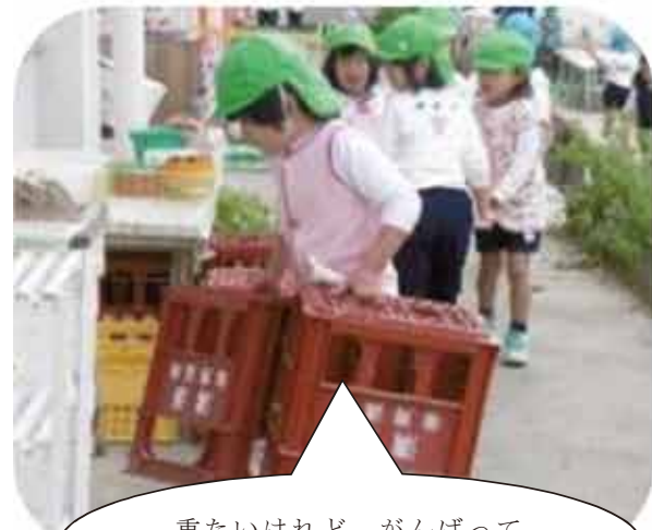
重たいけれど、がんばって片付けるよ！