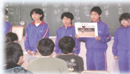
中学校の学習・部活・行事などを 小学生に説明している1年生