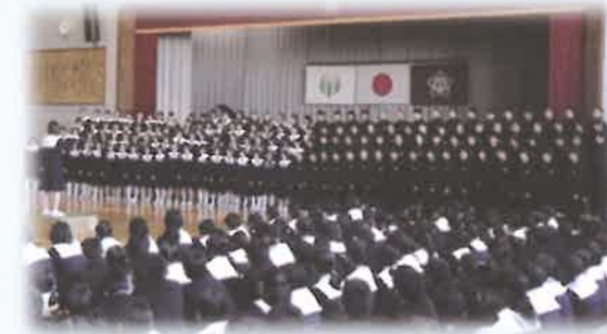
学年合唱を披露する2年生