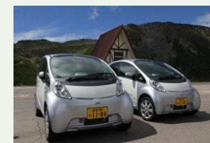
乗鞍スカイライン EVレンタカー実証実験事業（乗鞍自動車利用適正化協議会）