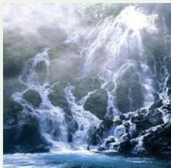
乗鞍山麓 五色ヶ原の森