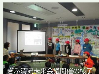
ぎふ清流未来会議開催の様子