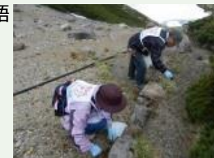
乗鞍美化の会による外来植物除去作業