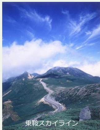
乗鞍スカイライン