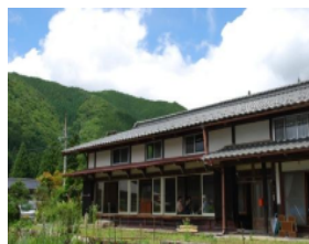
郡上の魅力が体感できる「里の宿 源右衛門」(明宝地内)