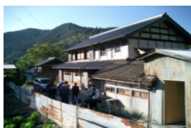
昨年9月に古民家を改修して開設した「田舎暮らし体験ハウス」(室兼地内)