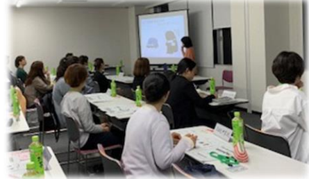
ゲートキーパー研修