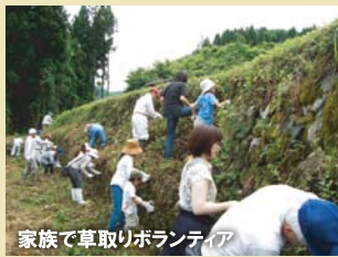
家族で草取りボランティア