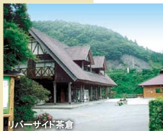
リバーサイド茶倉