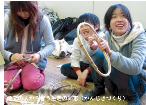
地元の人から習う生活の知恵（かんじきづくり）

グリーン・ツーリズム活動にかかる資源は地域ごとに多種多様なため、その資源や特徴にいかんが気づき活用するかが地域の特色や差別化につながります。本分科会ではそうした地域資源を活用しながら、今後の農村コミュニティ活性に影響の大きい外部からの移住をテーマとして、その視点や手法などについて参加者のみなさんと一緒に考えます。基調講演や移住促進施設「秋神の家」などの施設見学、パネルディスカッションなどを通して、移住促進をどう進めて継続していくのかを地域住民や行政、移住希望者など各立場から本音で語り合います。これによって多くの農村部が抱えている過疎化や高齢化によって不足しつつある農村の人材確保につながるような成果を目指します。