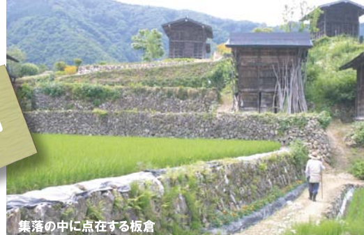
集落の中に点在する板倉

石積みの棚田のなかに板倉が点在する特徴的な景観を見せる種蔵は高齢者人口70%の過疎化が進む限界集落です。平成21年グリーン・ツーリズムの拠点施設として「板倉の宿 種蔵」が整備され、「種蔵を守り育む会」など地域住民による支援活動も始まりつつあります。