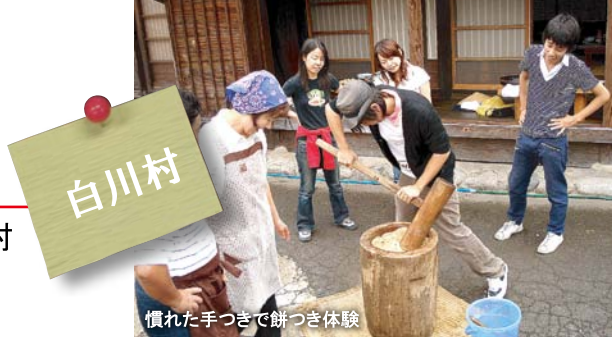
慣れた手つきで餅つき体験

白川村のグリーン・ツーリズムは、まだまだ発展途上(世界遺産の観光に依存しがち)です。日常に埋没している魅力を掘り出すには地域外の方の目と意見を必要とします。歴史や文化を紐解き、参加者の皆さんと一緒に白川村で実現可能なグリーン・ツーリズムの発掘を目指します。また、白川郷のグリーン・ツーリズムに取り組む人たちと、他地域の方々がワークショップを通して活発な意見交換を行い白川郷の新たな魅力創出につながることを期待しています。各地区を駆け足で見て回り、白川村の関係者を含めた小グループに分かれて討議・意見交換などを実施する予定です。