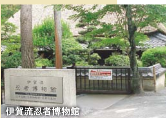
伊賀流忍者博物館