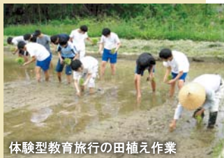
体験型教育旅行の田植え作業