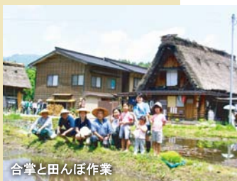
合掌と田んぼ作業