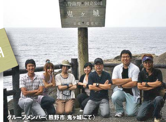
グループメンバー(熊野市 鬼ヶ城にて)

古の頃より、熊野路は地域の人々の生活道として使われており、また伊勢から熊野三山へと巡礼の人たちが歩いた道でもあります。東紀州分科会では、熊野古道伊勢路の馬越峠を巡礼の気持ちになって歩いていただきたいと思います。また、参加者の皆さんとのワークショップや交流会を通じて、グリーン・ツーリズムと地域づくりの課題について語り合い、学んでいきたいと考えています。