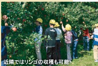
近隣ではリンゴの収穫も可能