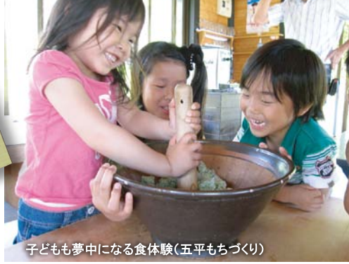
子どもも夢中になる食体験(五平もちづくり)

農家民宿におけるグリーン・ツーリズムでは、宿での様々な体験活動やふれあいにおかあさんの存在は欠かせません。おかあさんのもてなしがその宿の魅力の大きな要素であると言っても過言ではないでしょう。本分科会ではそうしたおかあさんの活動や魅力などにスポットを当てながら地域での課題を解決して農家民宿でのグリーン・ツーリズムがより充実し、広く発信していくことを目的に実施します。全国で活躍しているおかあさん達にも登場していただき、それぞれの取り組みや民宿での立場を紹介したり、若い世代からの意見、パネルディスカッションなどを通じて、地域での活動や課題などについて意見交換をします。夜の交流会では、一之宮地区のおかあさん達も集まり、グリーン・ツーリズム談義をさらに深めていきます。