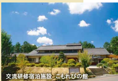
交流研修宿泊施設 こもれびの館