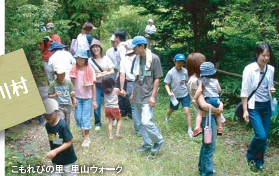
こもれびの里 里山ウォーク

「東白川村」を知っていますか？「寺のない村」、「ツチノコが棲むという村」。そんなちょっとミステリアスな村で、参加者のみなさんと村民が一緒になって、山里の隠れた魅力の発見とその魅力の伝え方を考える参加型のワークショップを開催します。参加者のみなさんには事前に山里「東白川村」の情報を提供し、実際に村を訪れてどこが魅力なのか、何が魅力なのかを発見し、アイデアを出し合いながらその伝え方を村民も交えてみんなで考えましょう。村民にもグリーン・ツーリズムの意識を高めるため、村内にPRし、ギャラリー席を設けてワークショップを公開方式で行い、参加者のスキルアップと気づきを得られる分科会にします。