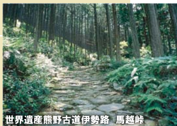
世界遺産熊野古道伊勢路 馬越峠