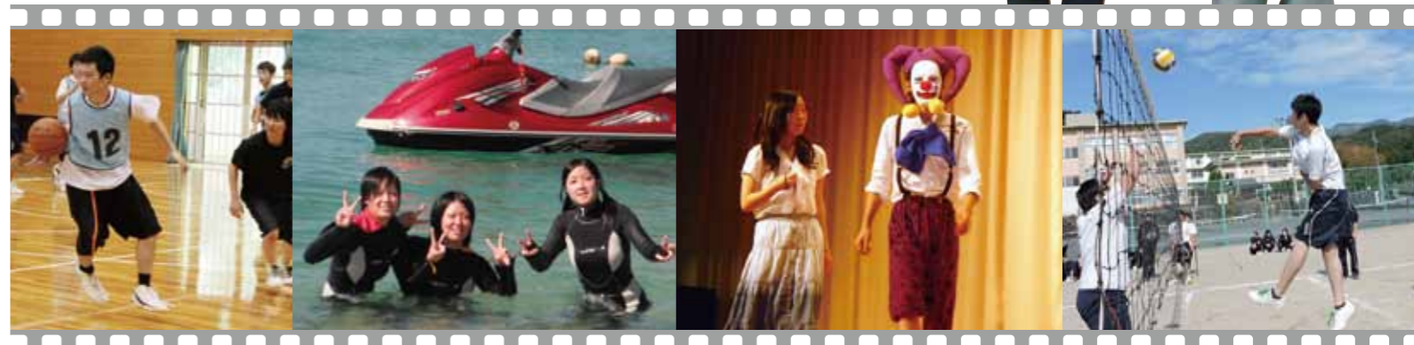
バスケットボール部

私は保育士になりたいという夢があり、坂下高校に入学しました。二年生から保育コースを選択し、保育検定の受検や保育園に実習に行かせていただく機会もあり、実際に子どもと関わる中で専門的な知識が身に付いたと思います。また、坂下高校はボランティア活動にも力を入れており、私自身たくさんのボランティア活動に参加させていただき、活動を通して責任感や相手を思いやる気持ちが身に付きました。今後も地域で活躍できる坂下高生を目指して頑張っていきたいです。