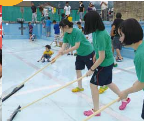
ボランティア活動(地域のプール清掃)