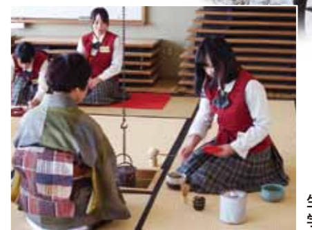
生活文化科の 学校茶道の授業

地域の通学支援策 <対象>中津川市在住の高校生(坂下高校以外も含む) <内容>市内路線バス等の定期券購入額から10,000円/月を控除した額の半額補助