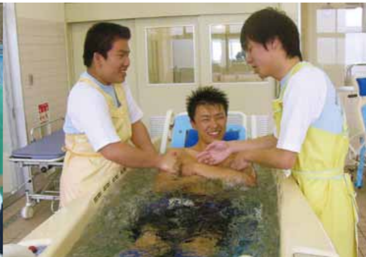
福祉科の入浴実習