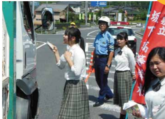
MSリーダーズによる交通安全運動

私は祖母と暮らしています。時々大変そうにしている時があり、福祉の勉強をして祖母の役に立ちたい、人の役に立ちたいと思い福祉の道に進むことを決めました。福祉科に入学し、介護実習やボランティアなどの場でたくさんの人に会いました。介護実習では利用者の方に「ありがとう」と言われることがとても嬉しく、これが福祉の仕事の魅力だと感じました。今は介護福祉士の資格を取得し、福祉施設で働いています。地域の一員として高齢者を支えることができる人材になれるよう頑張っていきたいと思っています。