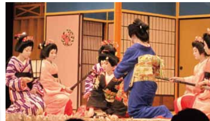
明智町歌舞伎大会に協力しました