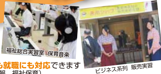
ビジネス系列 販売実習