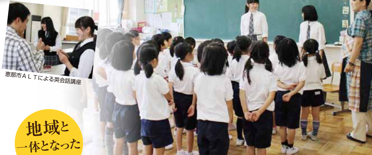
恵那市ALTによる英会話講座