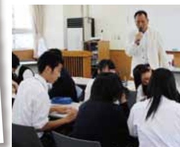
企業の方によるマーケティングの授業 (6次産業学習に関わって)