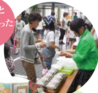
地域のイベントのお手伝い