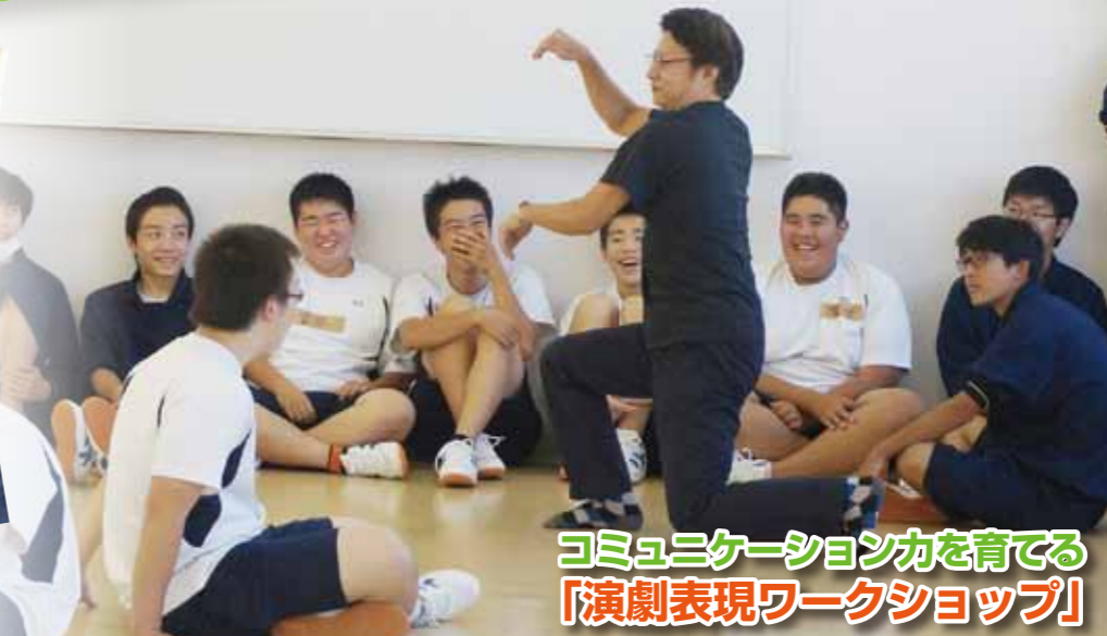
コミュニケーション力を育てる「演劇表現ワークショップ」