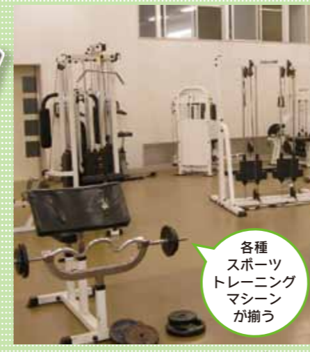
各種スポーツトレーニングマシンが揃う