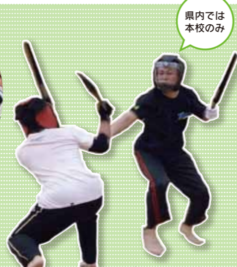
スポーツチャンバラ部