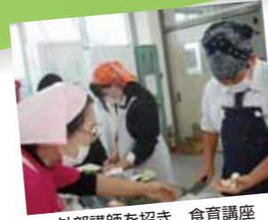
外部講師を招き 食育講座