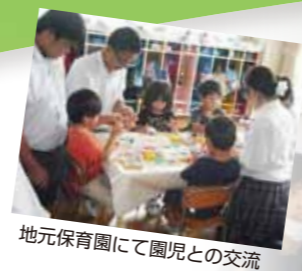
地元保育園にて園児との交流