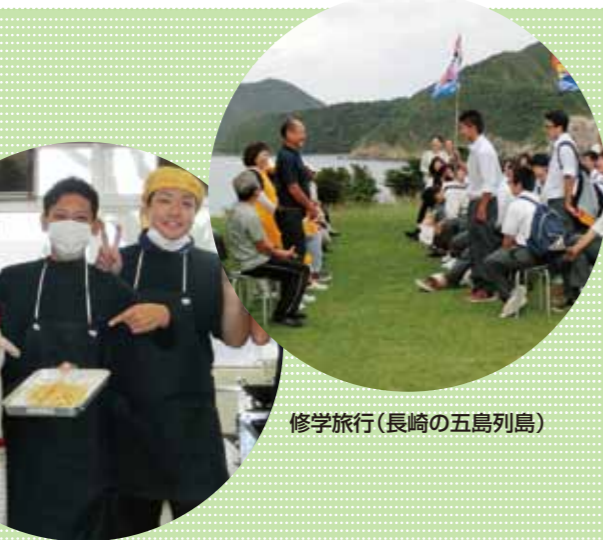
修学旅行(長崎の五島列島)