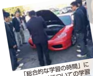
「総合的な学習の時間」にフェラーリについての学習