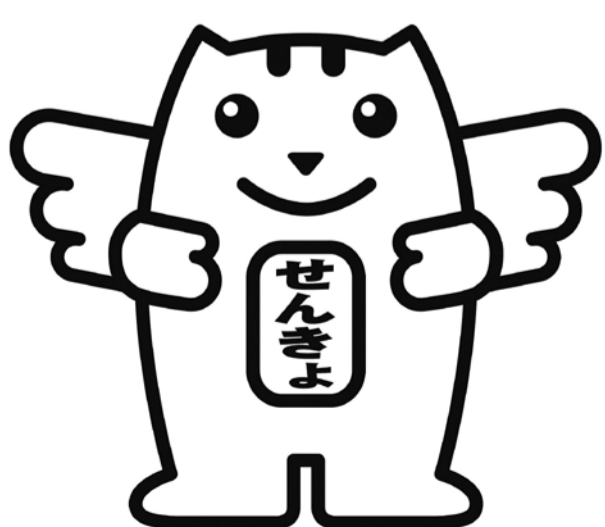
明るい選挙推進のイメージキャラクター 選挙のめいすい(明推)くん