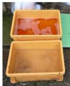
推奨される 踏込消毒槽の設置方法