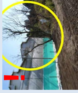
野鳥の休息・避難場所や小動物の移動経路となる樹木や藪がないか