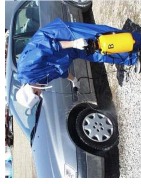
確実な車両消毒の実施