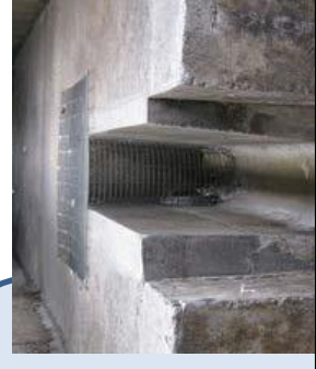
排水溝等からの侵入防止対策 (鉄格子の設置)