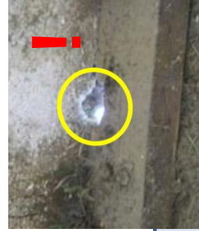
壁や床の破損がないか (外の光が漏れている所は要注意)