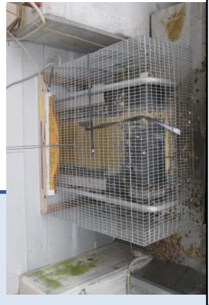
集卵用コンベアや除糞ベルトの開口部の隙間対策。(写真は、稼働時以外はカバーを設置し、隙間をなくしている事例。)