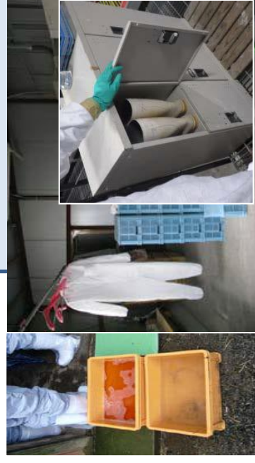
踏込消毒槽の設置・消毒液の交換 衣服や長靴の更衣・履替え