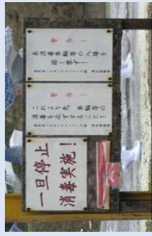
看板やゲートの設置