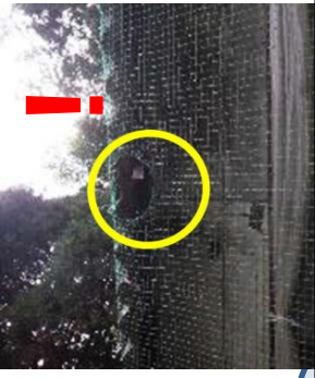
防鳥ネットの破れがないか