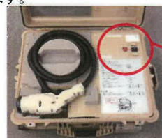
非常停止ボタン(赤)

電源ONの状態(READY)を確認した後、POWERスイッチを1回押す(電源を切る)